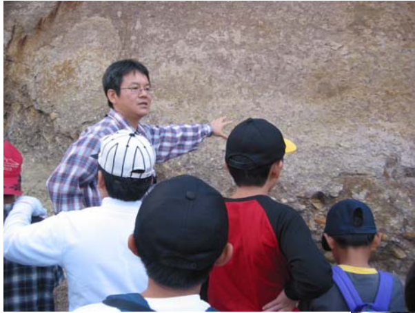
約1600万年前の新世代の地層である A地点を説明する講師（写真左）