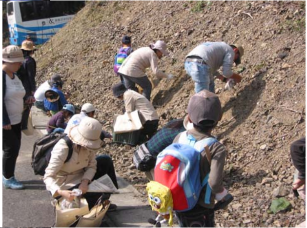
B地点で貝の化石を採集する会員 （写真右）