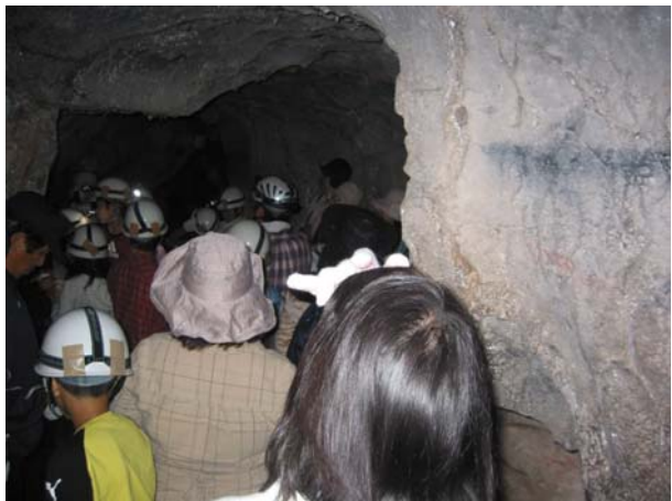
D地点の鍾乳洞を探検する会員 （写真右）