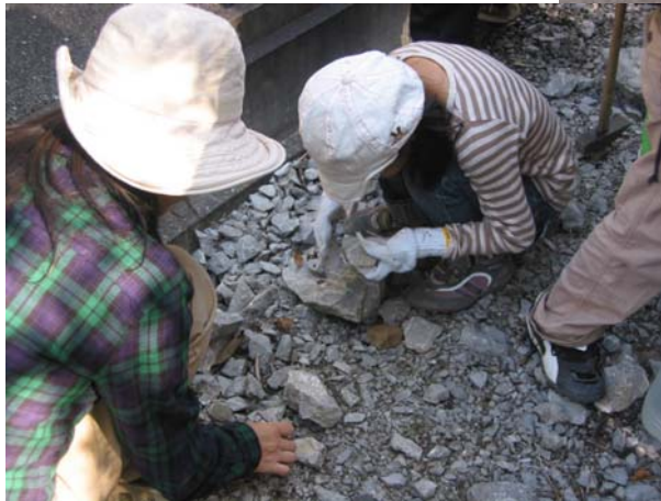
約3億年前のC地点でフズリナの化石を 採集する会員（写真左）