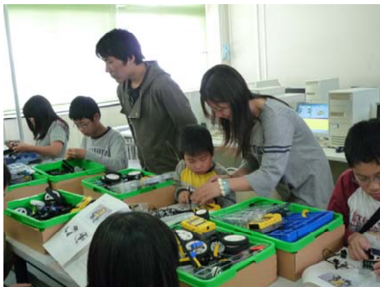
レゴロボットを組み立てる子供たち(写真右)