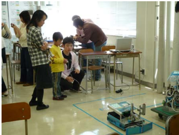
レスキューロボットを操縦する子供たち(写真左)