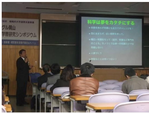
(左上図) 技術者による講演