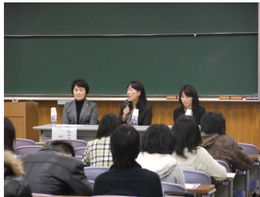
(右上図) 人事担当者によるディスカッション